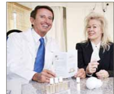
Prinzessin Nilufer, die Ambassadorin von «cell premium», bei einem cell premium Beauty-Treatment