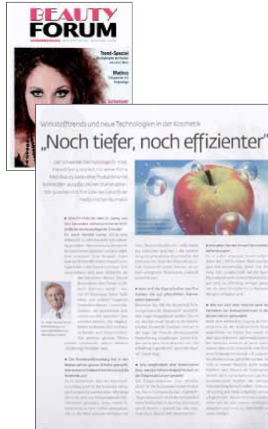
Beauty Forum, 2009