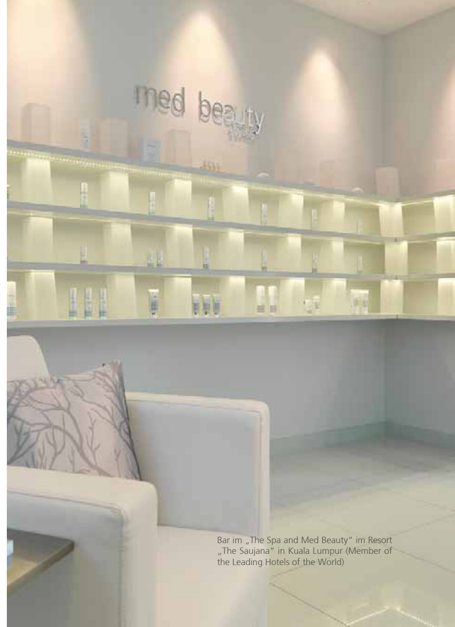
Bar im „The Spa and Med Beauty“ im Resort „The Saujana“ in Kuala Lumpur (Member of the Leading Hotels of the World)

Getreu dem Credo „Wissen schafft Schönheit“ werden durch gezielte Fortbildungen im modernen firmeninternen Schulungs Center, medizinisches Know-how in Bezug auf unsere Produkte und Behandlungsmethoden an Kosmetikfachfrauen und Ärzte vermittelt.