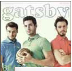
Malaysia. Tatler, Januar 2010