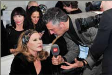
Ursula Andress (Hollywood-Schauspielerin) bei der Lancierung von «cell premium» im Interview mit dem Schweizer Fernsehen SF

Ihre Kaiserliche Hohheit Prinzessin Nilufer Sultane of Turkey, Erbin des osmanischen Reiches