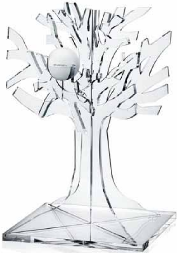
Der cell premium Baum designed von der Künstlerin Sonja Knapp (Designerin und Gründerin Modehaus «Emanuel Ungaro Paris»)