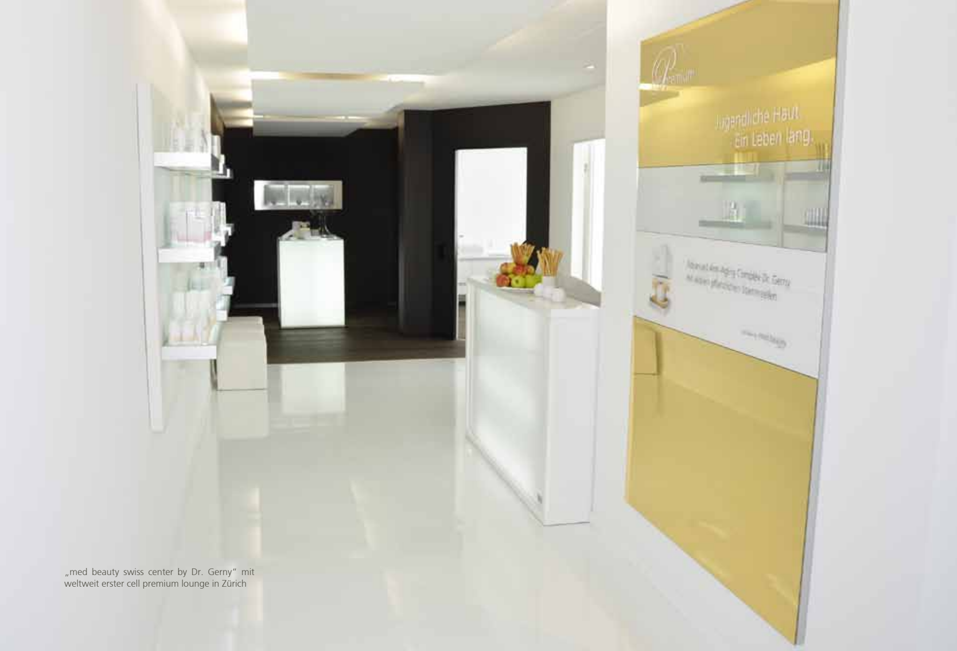
„med beauty swiss center by Dr. Gerny“ mit weltweit erster cell premium lounge in Zürich