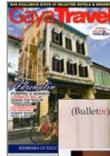
Malaysia, Astelier, Luxus Magazine von MasterCard, Februar 2010