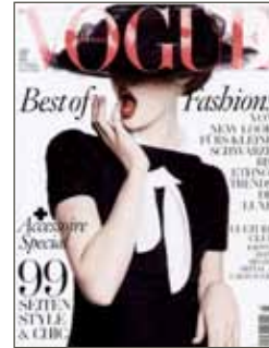
Attika Magazin, September 2010