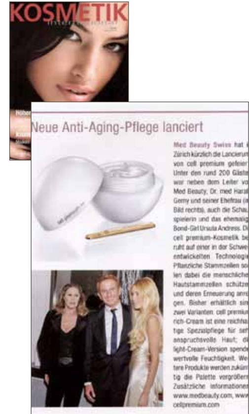
Kosmetik International, 2009