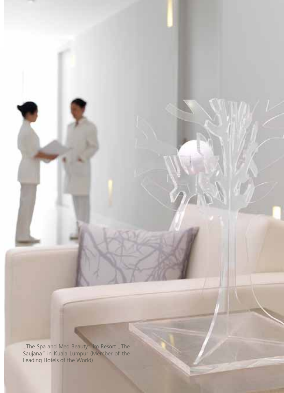
„The Spa and Med Beauty“ im Resort „The Saujana“ in Kuala Lumpur (Member of the Leading Hotels of the World)