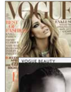
Bilanz, Januar 2010