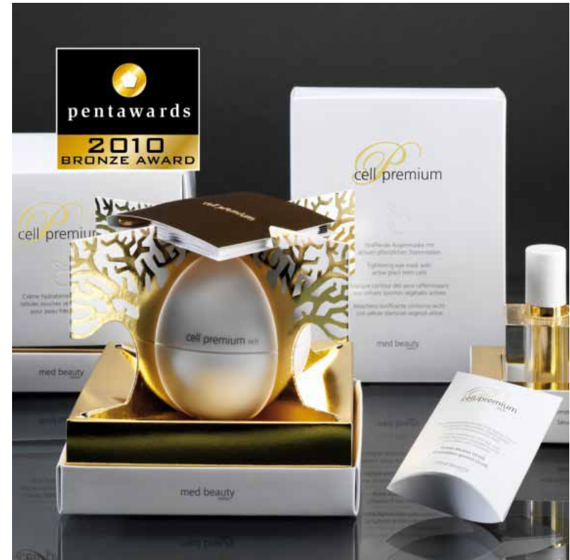
Die Verpackung von „cell premium“ wurde mit dem internationalen Design-Preis „Pentaward (Bronze)“ ausgezeichnet.

Das Packaging-Design von med beauty wird im Januar 2011 in der DesignPack Gallery in Paris ausgestellt ( www.designpackgallery.fr ). Die ausgezeichneten Packagings sind ebenfalls in einem TASCHEN Design-Buch zu finden, das in diesen Tagen weltweit in den Handel gelangt ( www.taschen.com ).