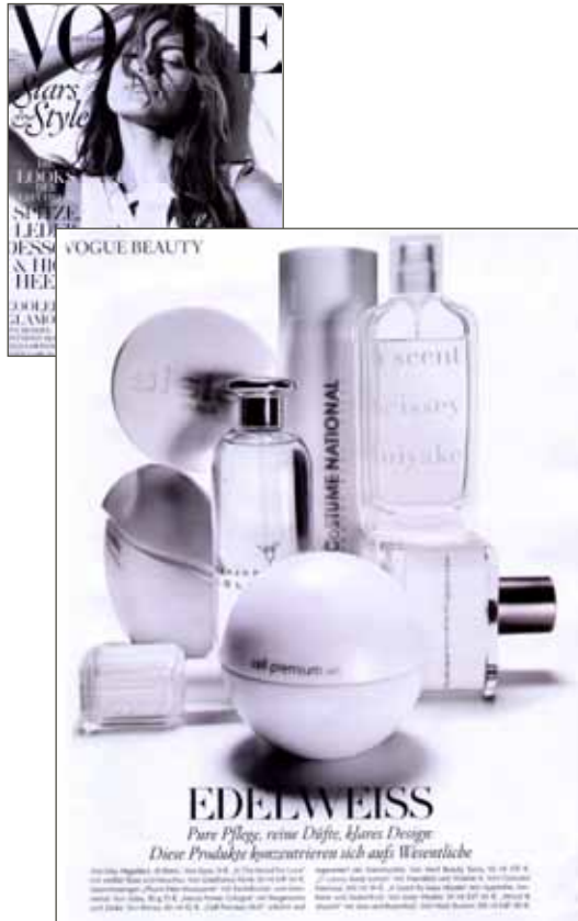
Vogue Deutschland, Februar 2010