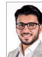
Devin Petrus Microblading, Permanent Make Up BeauLo Academy